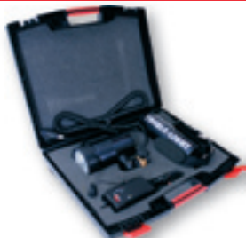
Platzsparend verstaut und immer griffbereit

Länge: 280mm Durchmesser: 100mm Gewicht: 4200g Akkuleistung: 12V/ 13Ah Gehäuse: seewasserbeständiges Aluminium Elektronik: Kapazitätsanzeige, Ein-/ Ausschalter Leuchtzeit: bei 50W-Lampe: ca. 3 Std Ladezeit: ca. 5 Std