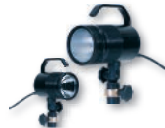
Wechseln von Spot- und Breitstrahlreflektor möglich.