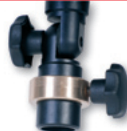
Stativhalter passt auf alle gängigen Stative.