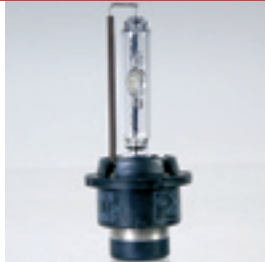
Xenon HID-Technik 50W - 12V/ 24V